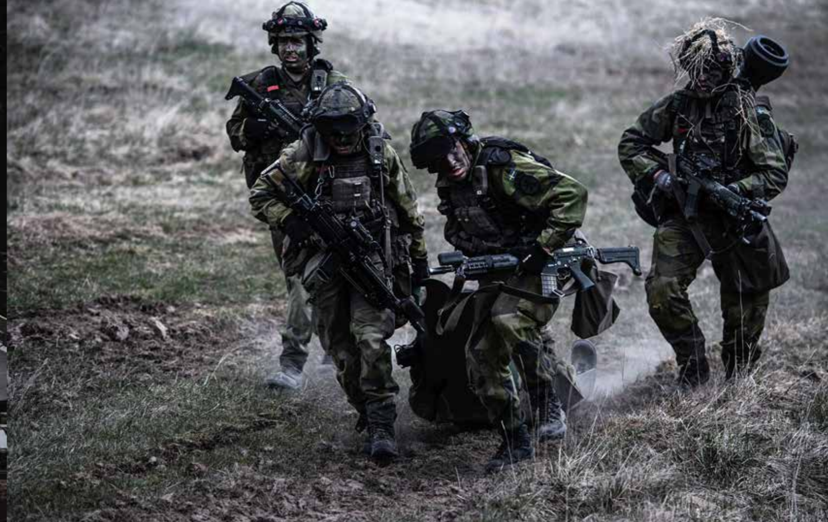
3 500 värnpliktiga, anställda och kadetter var med i övningen. För 20 år sedan var det inte ovanligt med fem gånger så många deltagare.

→ de olika funktionerna. Vi har inte kunnat öva det under så många år.