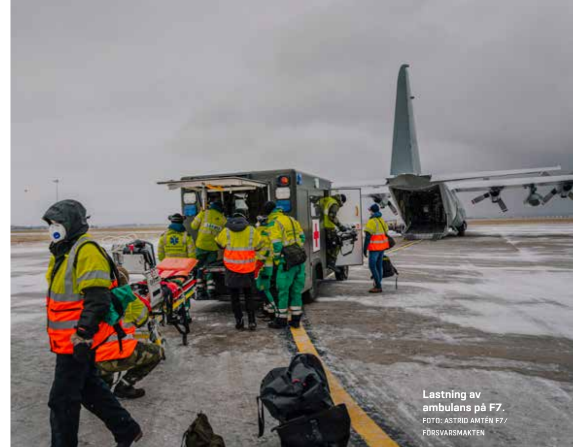
Lastning av ambulans på F7.