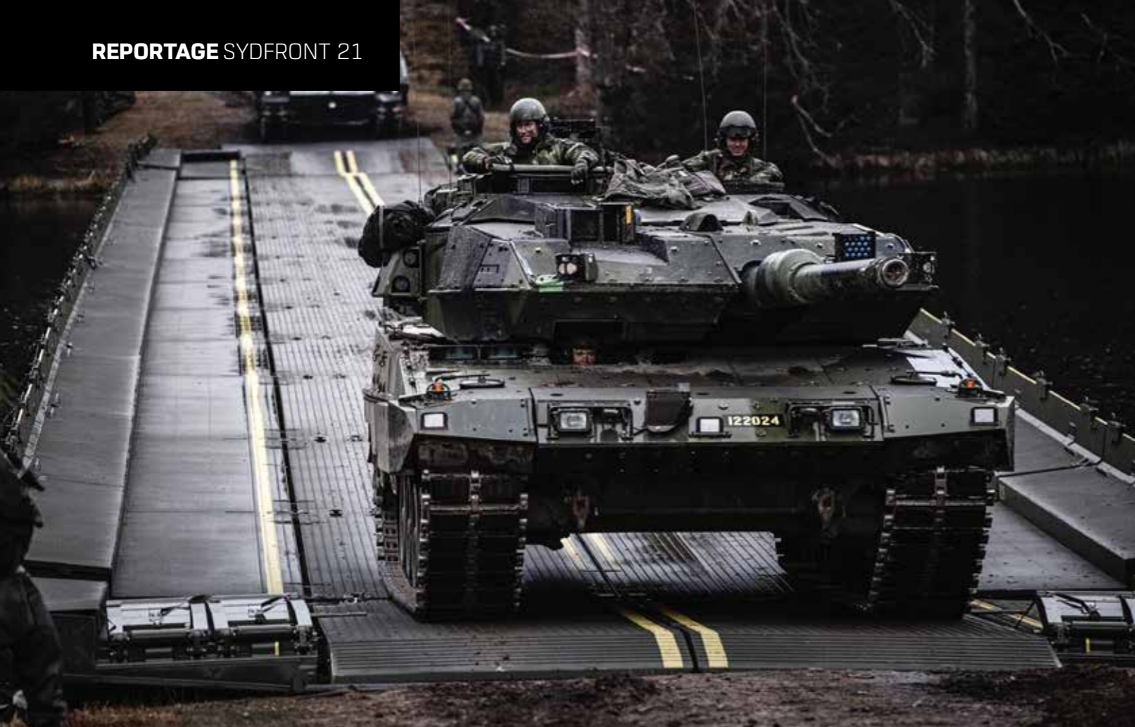
Det var länge sedan Försvarsmakten samlade sig till en stor mobiliseringsövning, Sydfront 21 är första stora övningen sedan 2010.