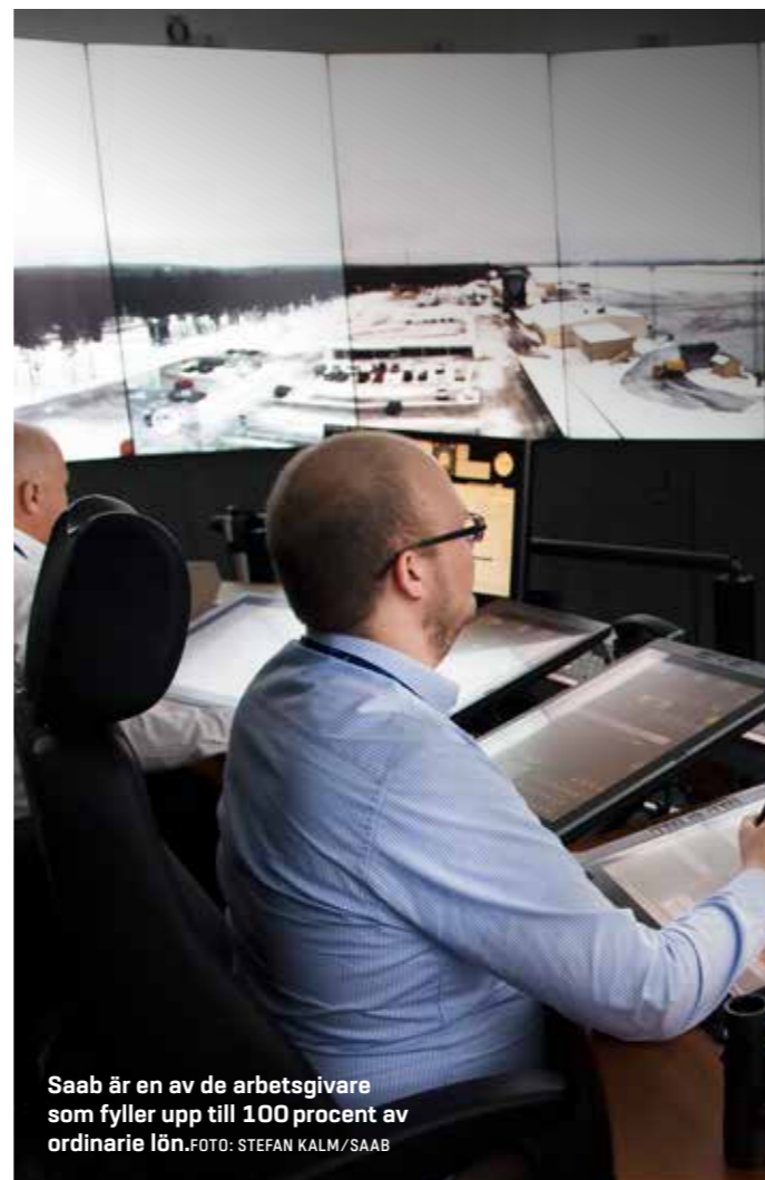
Saab är en av de arbetsgivare som fyller upp till 100 procent av ordinarie lön.