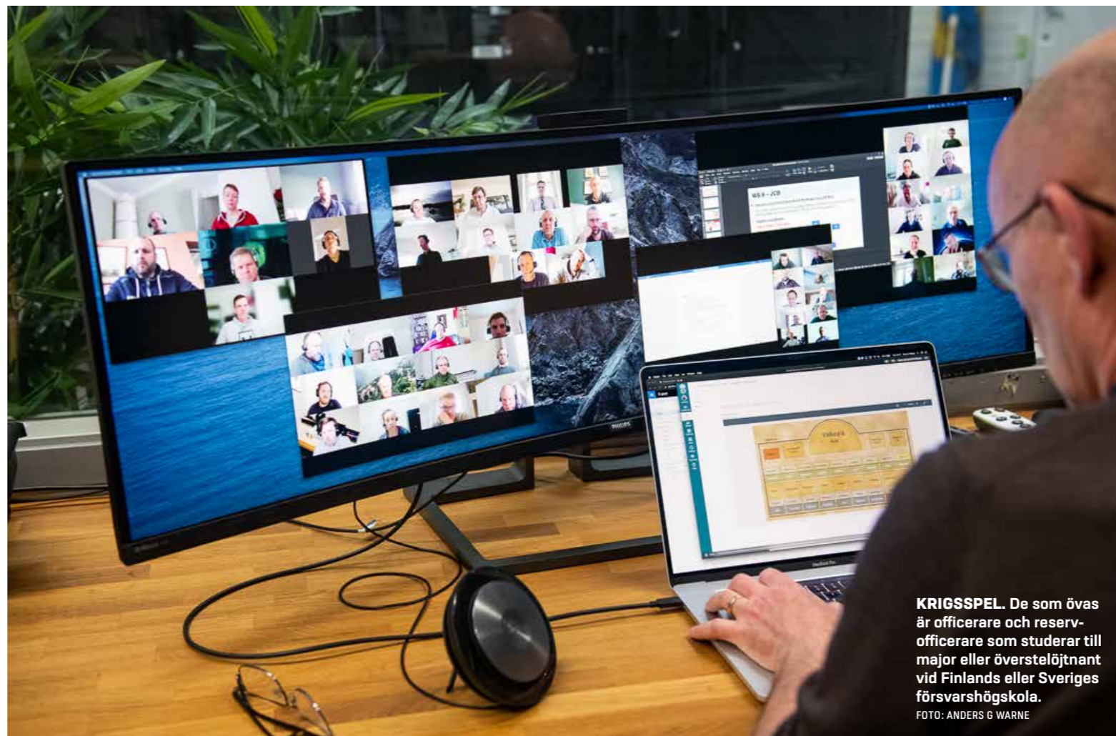
KRIGSSPEL. De som övas är officerare och reservofficerare som studerar till major eller överstelöjtnant vid Finlands eller Sveriges försvarshögskola.