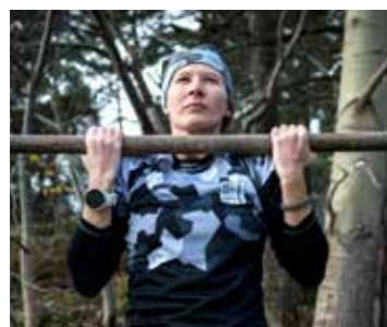
ARMHÄNG. Andas, andas, andas. Du orkar mer än du tror. Här är tipsen för att klara multitestet.