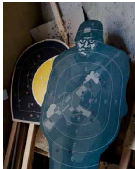
En kvarlämnad helfigurmåltavla i målboden.