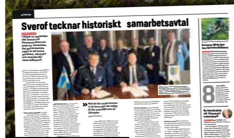
Publicerad i nr 3 2020.

Den strategiska time-outen är över och försvaret behöver mängder av reservare.