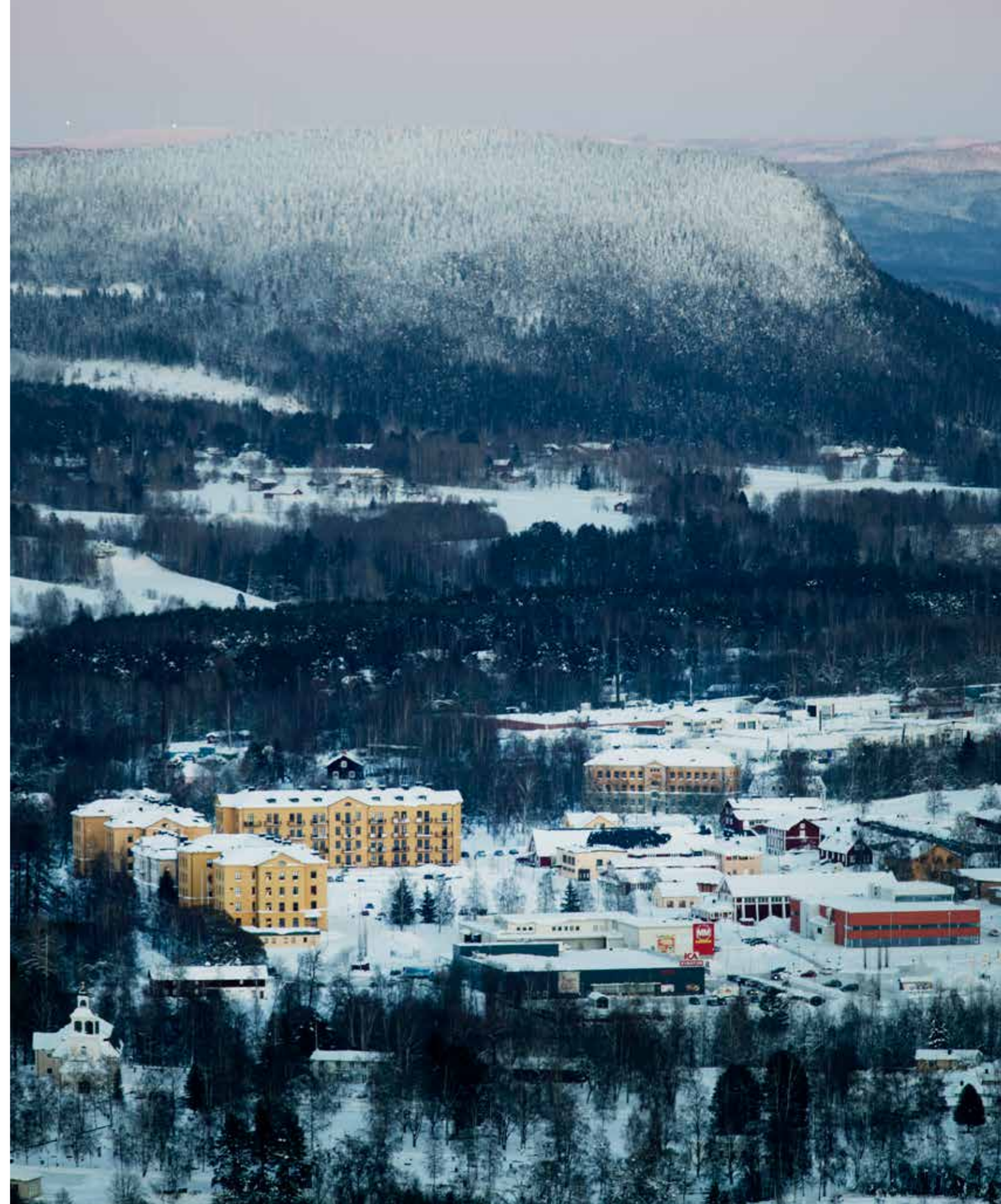
Från Hallstaberget kan man blicka ner över gamla I 21:s kasernområde, som numera benämns Hågesta. I bakgrunden syns Multräberget.