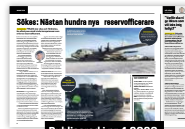
Publicerad i nr 4 2020.

OM PANDEMIN ger med sig hoppas man kunna bjuda in till gemensamma övningar i höst. Innan året är slut ska man sedan ha kopplat kompetens med krigsbefattning och inlett en plan för tjänstgöring.