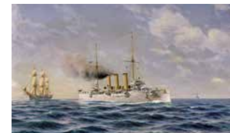
Pansarkryssaren Fylgia som var ett välkänt "långresefartyg". Sjösatt 1905 vid Finnboda varv. Konstverk av Jacob Hägg.