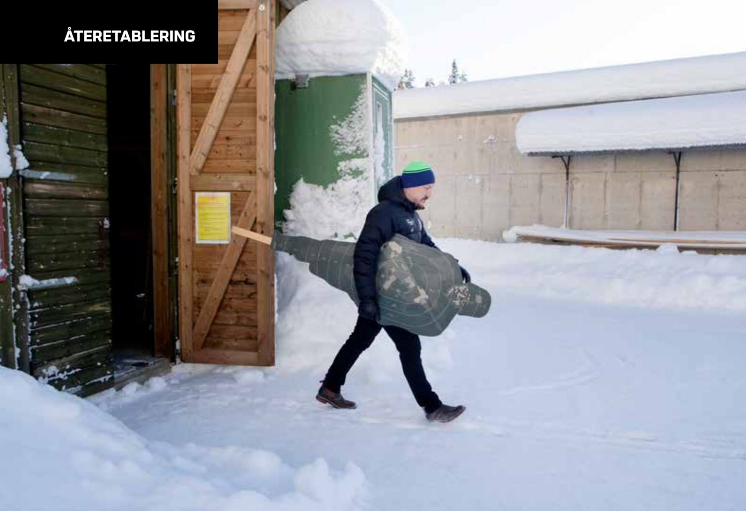
En stor tillgång för återetableringen i Sollefteå är de två övnings- och skjutfälten.

→ materiel, bygga upp logistikspår. Dessutom ska vi börja anställa yrkesofficerare och beställa värnpliktiga, samt även att fylla upp förbanden, eller i alla fall göra en personalplan för dem.