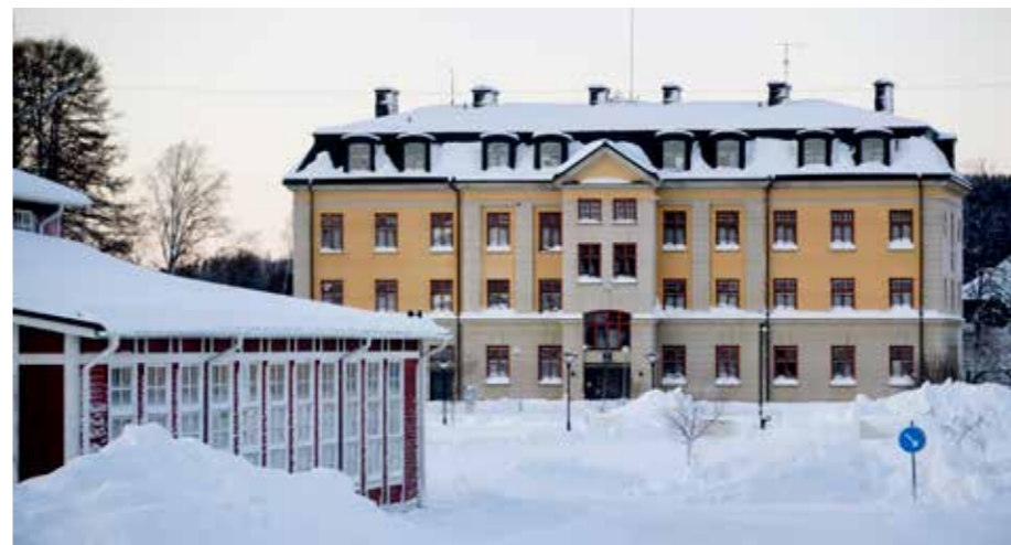
Kanslihuset, där regementschefen och regementsstaben huserade. I förgrunden ett material och serviceförråd som tidigare var matsal fram till mitten av 1900-talet.

till budgetunderlaget i mars. Processerna har dock inletts på alla platser, berättar han. När det gäller rekryter är Kristinehamn och Sollefteå de regementen som