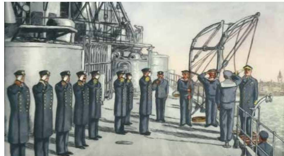
Blås över! Amiralen kommer ombord.